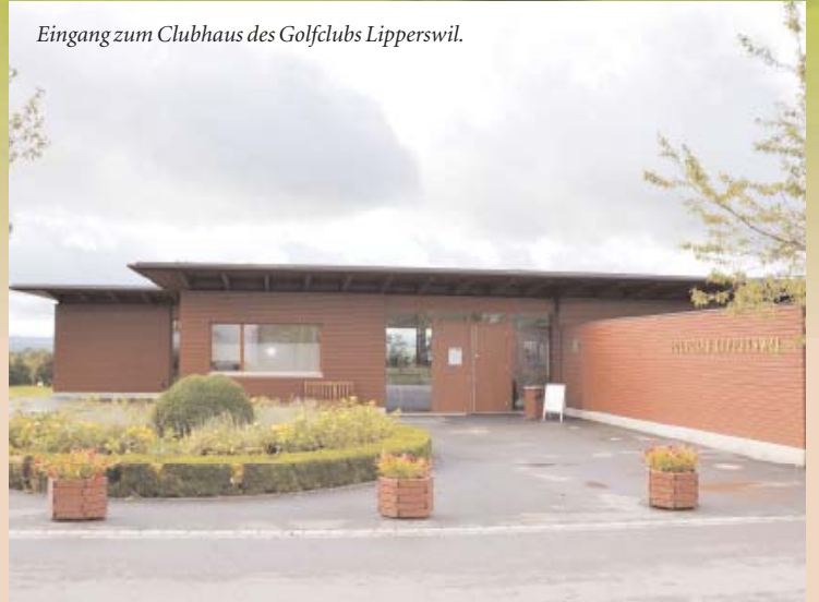
Eingang zum Clubhaus des Golfclubs Lipperswil.

Minimalinvasive Zahnerhaltung (Bleaching, Seeling, Reparaturen), ein Update zur adhäsiven Zahnmedizin (Kleben, Füllen) sowie Workshops zur ästhetischen Frontzahnkorrektur komplettierten das überaus informative Wochenprogramm.