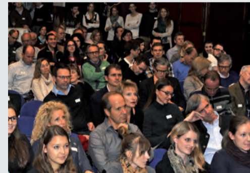
Der Saal im Kaufleuten Zürich war zum Jahresrückblick mit über 250 Besuchern voll besetzt.

32670094-CH-1309 © 2013 DENTSPLY Implants. All rights reserved.