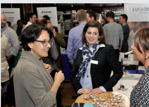
Im Foyer präsentierten acht Aussteller ihre Produkte und freuten sich über das rege Interesse der Besucher.