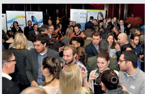
Nach den Vorträgen war Zeit, mit Kollegen auf das ablaufende Jahr zurückzublicken.