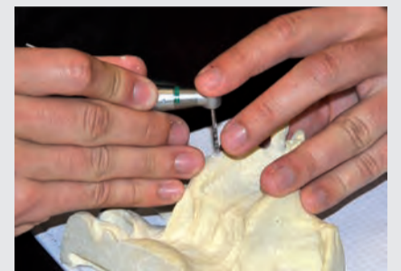
Übungen an einem künstlichen Oberkiefer.