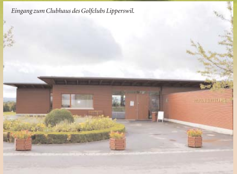
Eingang zum Clubhaus des Golfclubs Lipperswil.

Minimalinvasive Zahnerhaltung (Bleaching, Seeling, Reparaturen), ein Update zur adhäsiven Zahnmedizin (Kleben, Füllen) sowie Workshops zur ästhetischen Frontzahnkorrektur komplettierten das überaus informative Wochenprogramm.